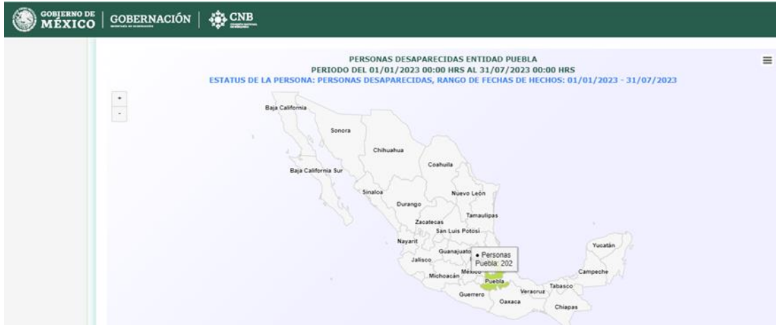
Imagen 3. Registro de hombres y mujeres desaparecidos en el estado de Puebla, en el periodo comprendido del 1 de enero al 31 de julio de 2023. RNDPNO

enero y el 31 de julio de 2023, desaparecieron en el estado de Puebla, 72 mujeres, 1 indeterminado y 129 hombres.