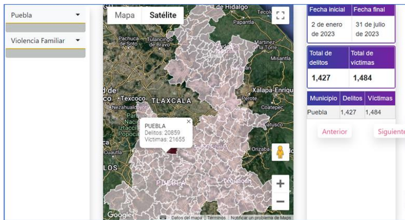
Imagen 1. Violencia familiar en Puebla Capital, de enero a julio de 2023. FGEP. 34

En el caso de la violencia familiar, la figura jurídica no señala que sea emprendida exclusivamente por la pareja sino por parte de cualquier integrante de ese grupo.